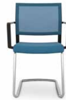
407.5000 + al420