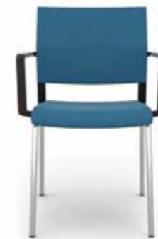
406.0000 + al420