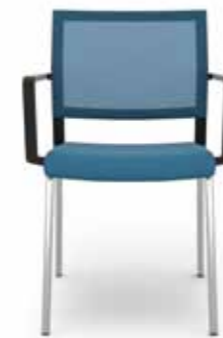
406.5000 + al420