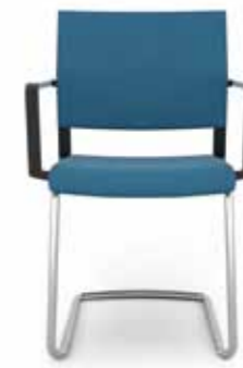
407.0000 + al420